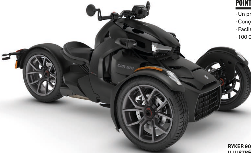
RYKER 900 ILLUSTRÉ AVEC DES PANNEAUX NOIR INTENSE